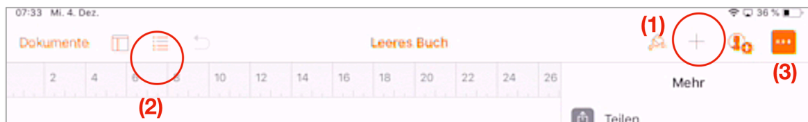
Screenshot Pages iOS

Bei der Verwendung einer Querformatvorlage müssen neue Seiten manuell hinzufügen werden.