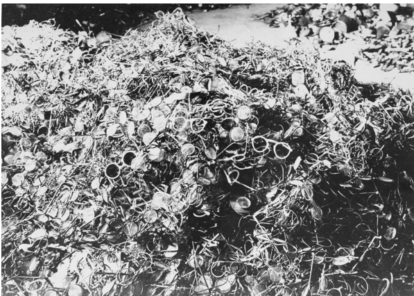
Fund im KZ Auschwitz bei dessen Befreiung im Januar 1945, Ein Berg voller Brillen