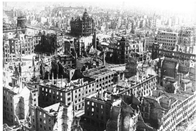
Die durch alliierte Luftangriffe zerstörte Dresdner Innenstadt im Jahr 1945