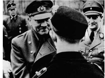
Letztes existierendes Foto Hitlers, März 1945 (Vorsicht, Propagandaaufnahme!)

11 Propaganda und Machterhalt im letzten Kriegsjahr: