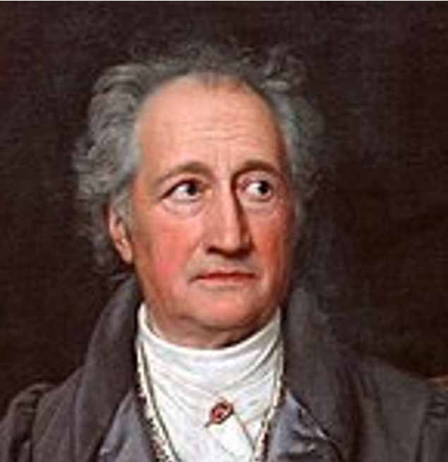
Joseph Karl Stieler