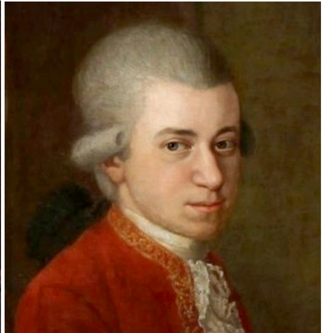
Joseph Karl Stieler, Public domain, via Wikimedia Commons

💡 Wolfgang Amadeus Mozart, der überwiegend mit Wolfgang Amadé Mozart unterschrieb [1] (* 27. Jänner 1756 in Salzburg, [2] Fürsterzbistum Salzburg, HRR; † 5. Dezember 1791 in Wien, [3] Erzherzogtum Österreich, HRR), war ein Salzburger [4] und österreichischer Musiker und Komponist der Wiener Klassik. Sein umfangreiches Werk genießt weltweite Popularität und gehört zum Bedeutendsten im Repertoire klassischer Musik. Quelle: Wikipedia