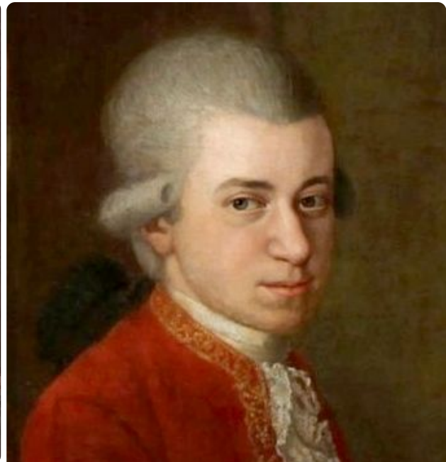
Joseph Karl Stieler, Public domain, via Wikimedia Commons