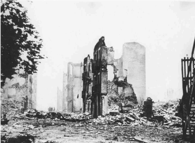
Das zerstörte Guernica (1937)