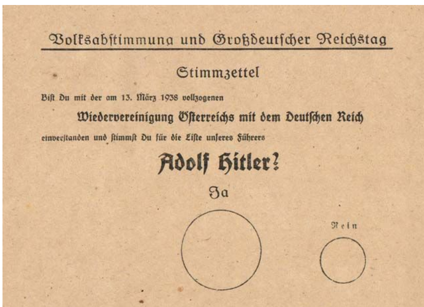
Stimmzettel zur Volksabstimmung am 10.4.1938