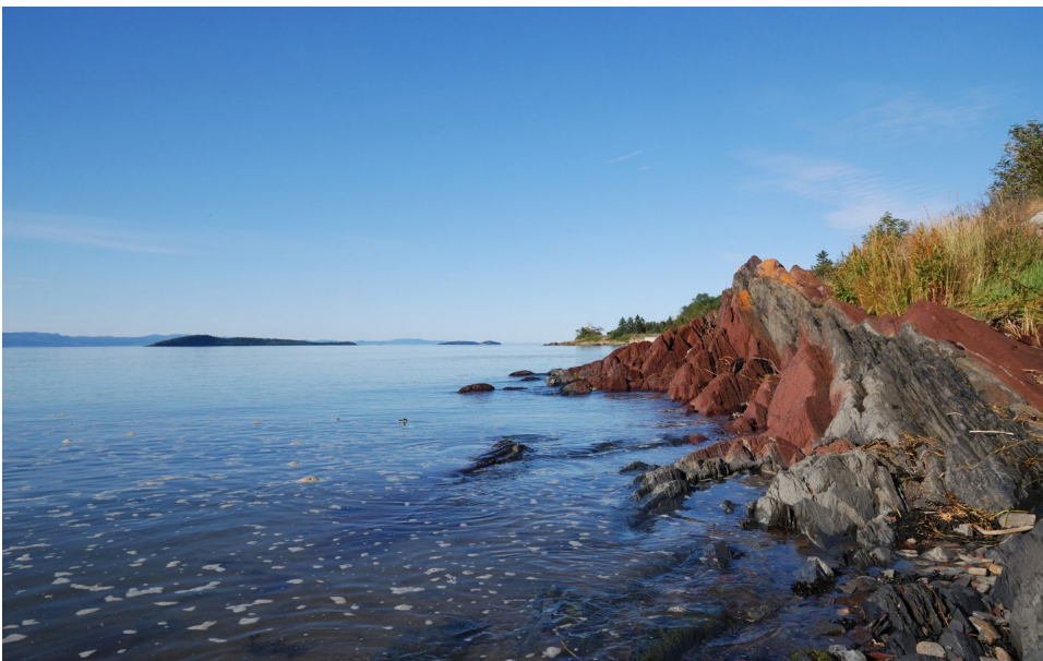
QC - Ufer Sankt Lorenzstrom bei Kamouraska