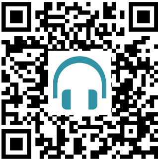
Edvard Grieg: „Morgens Stimmung“ aus Peer Gynt Suite

Henrik Ibsen und Edvard Grieg hatten sich 1866 in Rom kennengelernt. Zu dieser Zeit arbeitete Ibsen an dem dramatischen Gedicht Peer Gynt nach der Vorlage norwegischer Märchen von Peter Christen Asbjørnsen. Nach dem Erfolg der Dichtung plante Ibsen, sie zu einem Bühnenstück umzuarbeiten, und beauftragte Grieg, die Musik dafür zu schreiben. Das Theaterstück wurde zusammen mit Griegs Schauspielmusik am 24. Februar 1876 uraufgeführt.