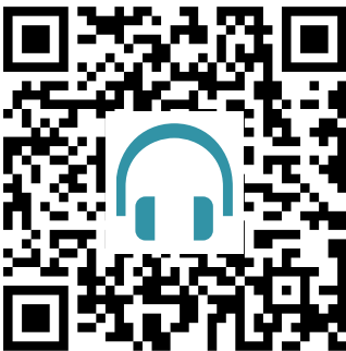
Bedřich Smetana: „Die Moldau“

Henrik Ibsen und Edvard Grieg hatten sich 1866 in Rom kennengelernt. Zu dieser Zeit arbeitete Ibsen an dem dramatischen Gedicht Peer Gynt nach der Vorlage norwegischer Märchen von Peter Christen Asbjørnsen. Nach dem Erfolg der Dichtung plante Ibsen, sie zu einem Bühnenstück umzuarbeiten, und beauftragte Grieg, die Musik dafür zu schreiben. Das Theaterstück wurde zusammen mit Griegs Schauspielmusik am 24. Februar 1876 uraufgeführt.