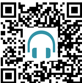
Robert Schumann: „Träumerei“ aus seinem Zyklus „Kinderszenen“

Die Moldau ist der zweite Teil aus „Mein Vaterland“, einem Zyklus von sechs sinfonischen Dichtungen des tschechischen Komponisten Bedřich Smetana. Die Komposition zeichnet den Lauf des gleichnamigen Flusses nach und gehört zu den berühmtesten Werken der Programm-musik . Das Werk entstand 1874, als Smetana bereits vollständig ertaubt war und wurde am 4. April 1875 in Prag uraufgeführt.