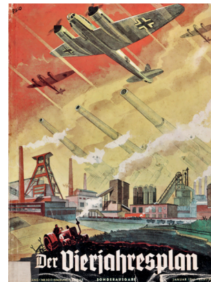
Cover der Broschüre „Der Vierjahresplan“, Januar 1941