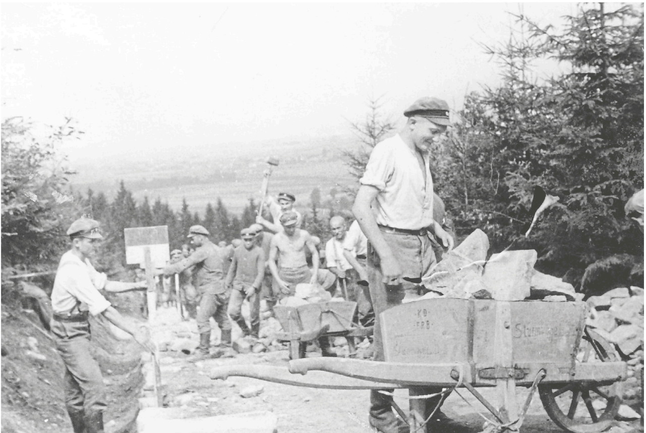
Propagandabild um 1938

Arbeiter des „Reichsarbeitsdienstes“ beim Straßenbau in der Nähe von Meißen. Anfänglich wurden solche Vorhaben gezielt arbeitsintensiv angelegt, um möglichst viele Arbeitskräfte zu binden.