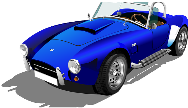
wagen, auto, sportwagen