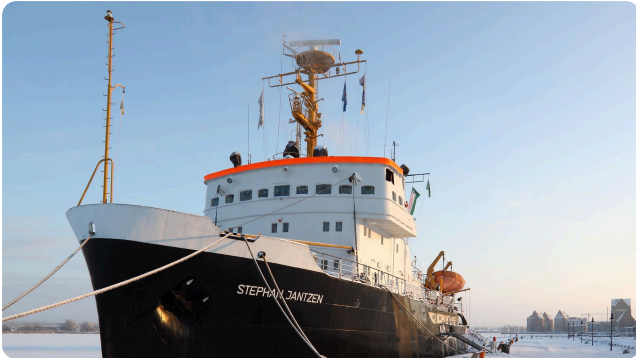
Icebreaker Stephan Jantzen in Stadthafen Rostock 2010-12-28 perspective correction-GD