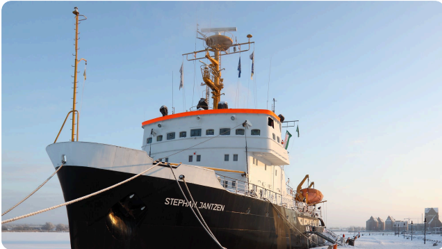
Icebreaker Stephan Jantzen in Stadthafen Rostock 2010-12-28 perspective correction-GD