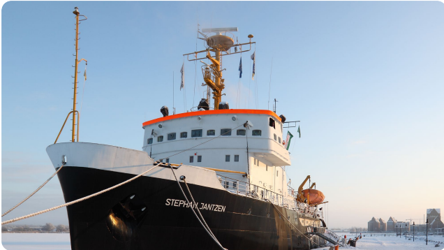
Icebreaker Stephan Jantzen in Stadthafen Rostock 2010-12-28 perspective correction-GD