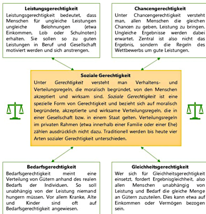
Schaubild „Soziale Gerechtigkeit“