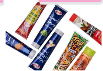
die Tube (Nahrung)