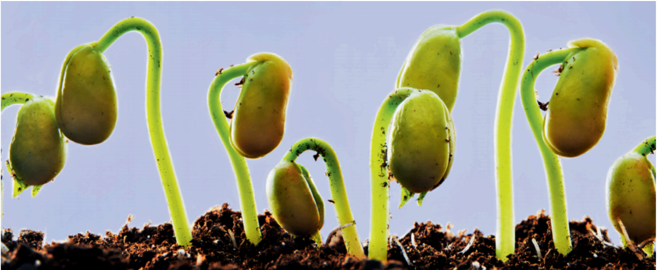
1 Keimende Bohnenpflanzen

Diese seltsamen kleinen Pflänzchen haben sich aus Bohnensamen entwickelt. Bohnensamen lassen sich trocken sehr lange lagern. Was ist nötig, damit sich aus einem Samen eine Pflanze entwickelt?