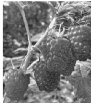
Himbeeren am Strauch