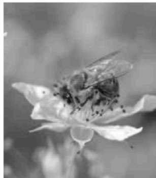
Himbeerblüte mit Bienenbesuch