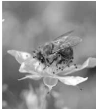
Himbeerblüte mit Bienenbesuch