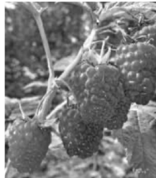
Himbeeren am Strauch