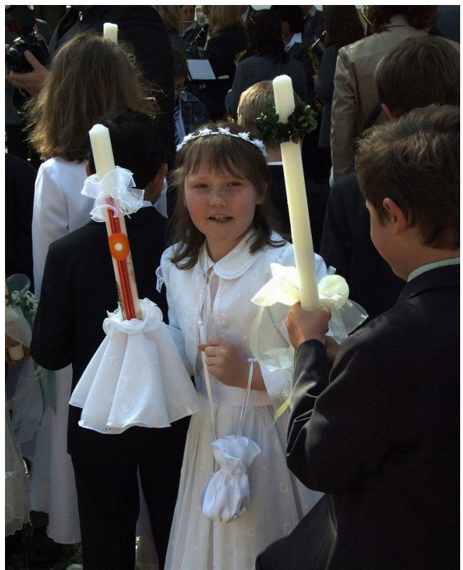
Erstkommunion: Ein Fest katholischer Christen

Wer nach wie vor von seinem Glauben überzeugt ist, kann seine Zugehörigkeit zur Kirche nun noch einmal neu bestätigen. Die Firmung ist die Vollendung der Taufe: Den Jugendlichen wird wie bei der Taufe mit Öl ein Kreuz auf die Stirn gezeichnet.