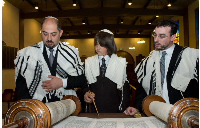
Bar Mitzwa eines jüdischen Jungen

Zu viel Text? Auf dem AB findest du einen Film zur Bar Mitzwa .