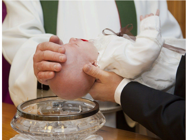
Die Taufe im Christentum

Dem Kind wird bei der Taufe Weihwasser aus dem Taufbecken über die Stirn gegossen. Dann wird mit Chrisam-Öl von Pfarrer, den Eltern und den Taufpaten ein Kreuzzeichen auf die Stirn des Kindes gezeichnet. Stellvertretend für das Kind bekennen die Eltern und Taufpaten ihren Glauben.