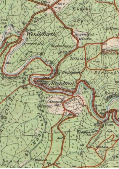
Altenbrak Karte 1912 - Maßstab 1 : 50.000

Du kannst den Maßstab auch mit dem Dreisatz berechnen! Eigentlich ist es ja ein „ Zweisatz “!