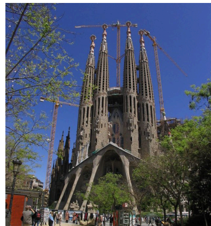
La Sagrada Familia