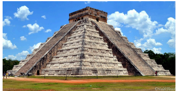
Pirámide de Kukulcán