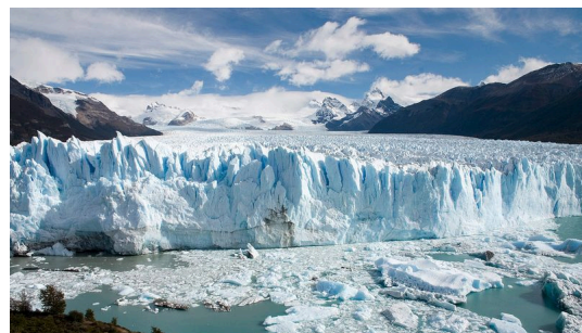
El Glaciar 'Perito Moreno'