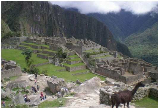
El Machu Picchu