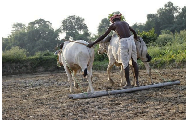
Nutz- und Arbeitstier