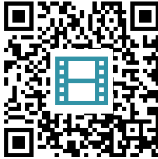
Epoche der Romantik 2