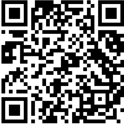
Bewegung auf der Zahlengeraden