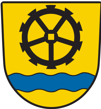
Wappen der Gemeinde Wutöschingen