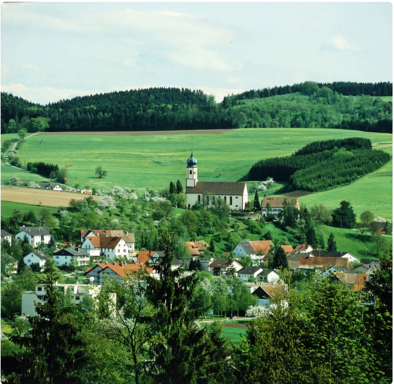
Deger nau 1985 / Hans Ruppaner