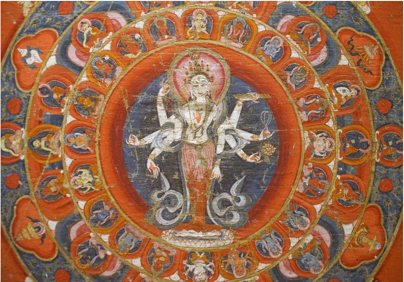
Mandala d'Amoghapasha (Musée Gulmet, Paris)

Das Mandala ist ein geometrisches Schaubild, das im Hinduismus und Buddhismus eine magische oder religiöse Bedeutung besitzt. Ein Mandala ist meist quadratisch oder kreisrund und stets auf einen Mittelpunkt orientiert.