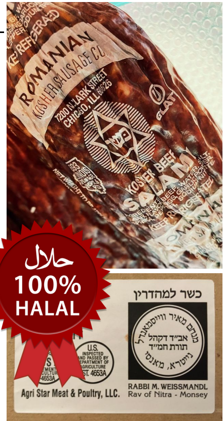
div. „koscher“ und „halal“ Siegel

Beide Religionen haben zudem gemeinsam, dass nur Fleisch von geschächeteten Tieren verwendet werden darf. Das ist eine spezielle Art der Schlachtung.