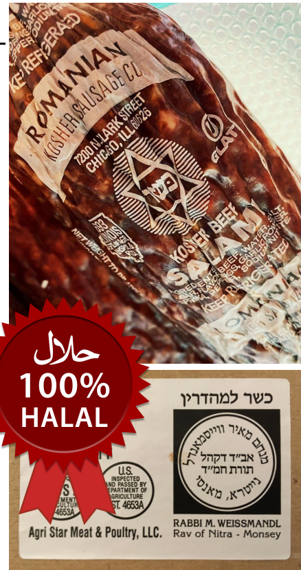
div. „koscher“ und „halal“ Siegel

Beide Religionen haben zudem gemeinsam, dass nur Fleisch von geschächeteten Tieren verwendet werden darf. Das ist eine spezielle Art der Schlachtung.