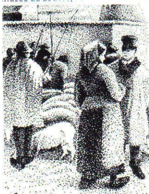
Camille Pissarro, St. Martinsmarkt von Pontoise, 1886

Der Punkt ist ein . Durch viele Punkte kann man , , und erzielen.